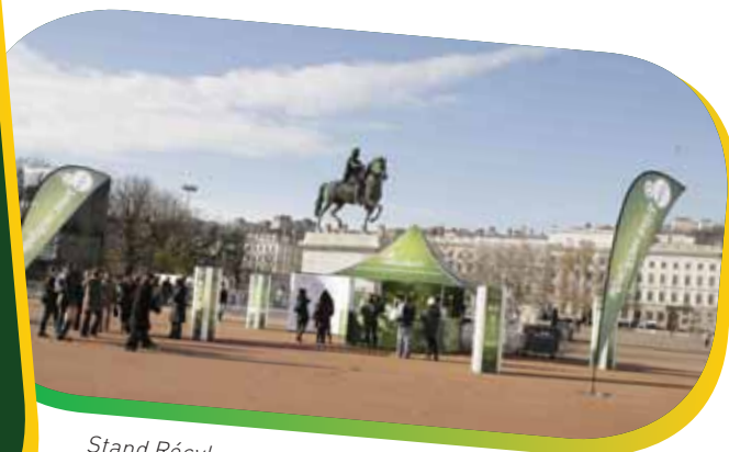
Stand Récyllum sur la place Bellecour Fête des Lumières 2009