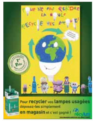
Affiche gagnante 2010

Les élèves gagnants verront leur affiche diffusée sur 125 panneaux publicitaires dans les rues de Lyon pendant la Semaine du Développement Durable 2012 !