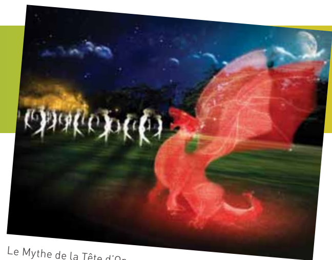
Le Mythe de la Tête d'Or

→ Le parcours-spectacle du « Mythe de la Tête d'Or » est un conte de fées moderne, porteur d'un message éco-responsable. C'est l'histoire d'un Homme face au règne de la nuit en quête de la lumière. Les visiteurs entrent dans un monde fantastique peuplé de géants, d'elfes, et de créatures extraordinaires. Ils deviennent les héros de l'histoire et participent à la bataille de la lumière qui les conduit sur le chemin