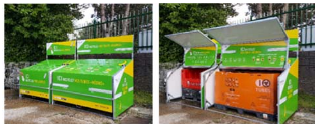
Abris fermés protégeant les conteneurs de lampes des intempéries.

Thomas Marko & Associés • Aveline Bongiovi Tél. : 01 44 90 85 29 • aveline.b@tmarkoagency.com